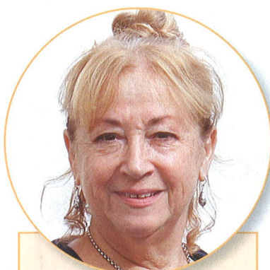
IVANA JANŮ, předsedkyně Úřadu pro ochranu osobních údajů