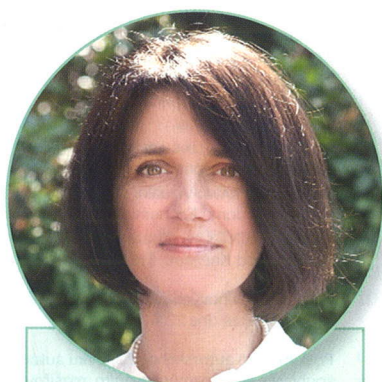
KATEŘINA ŠIMÁČKOVÁ, soudkyně Ústavního soudu