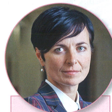
LENKA BRADÁČOVÁ, vrchní státní zástupkyně v Praze