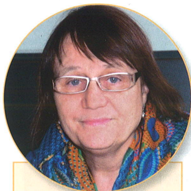
ANNA ŠABATOVÁ, veřejná ochránkyně práv