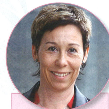
PAVLA FUČIKOVÁ, prezidentka Exekutorské komory ČR